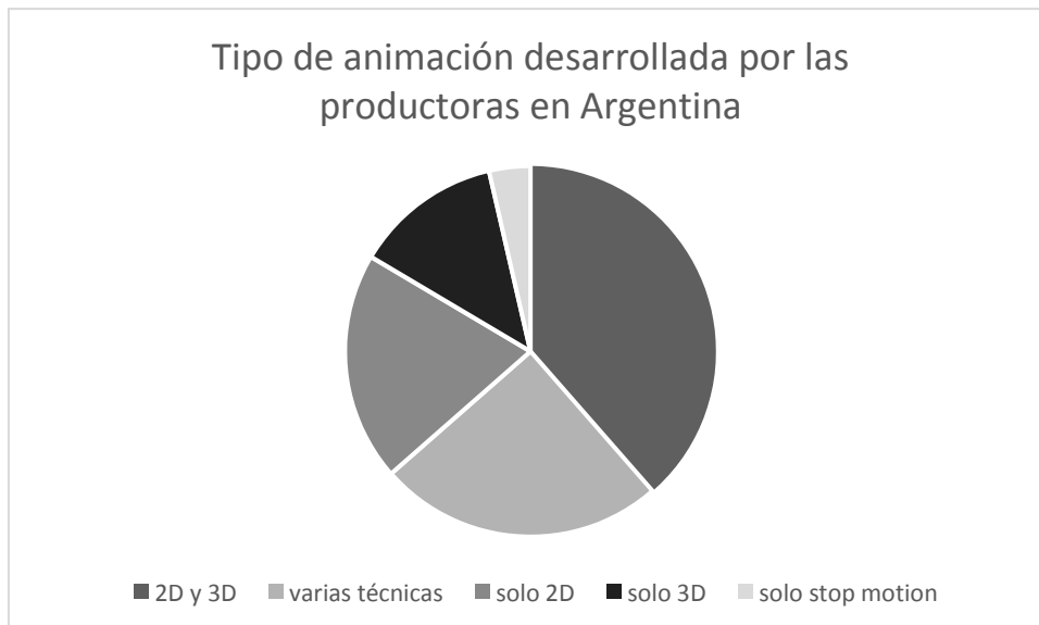
Gráfico de elaboración propia con información del Libro Blanco Quirino de la Animación Iberoamericana. Edición 2019.

A su vez, las mismas manejan distinto tipo de animación, lo que representamos en el gráfico a continuación: